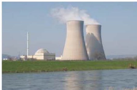
ਪ੍ਰਮਾਣੂ ਊਰਜਾ ਪਲਾਂਟ