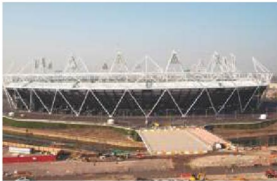
ਜਵਾਹਰਲਾਲ ਨਹਿਰੂ ਸਟੇਡੀਅਮ